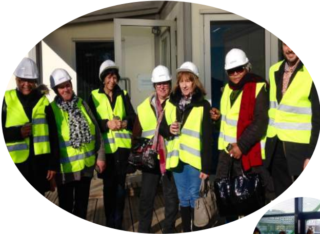
Visite d'un centre de tri