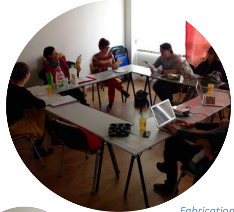
Fabrication de produits ménagers