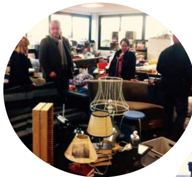
Visite d'une ressourcerie